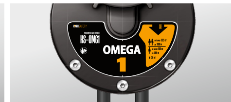
Рис. 2 Трудноудаляемая этикетка.